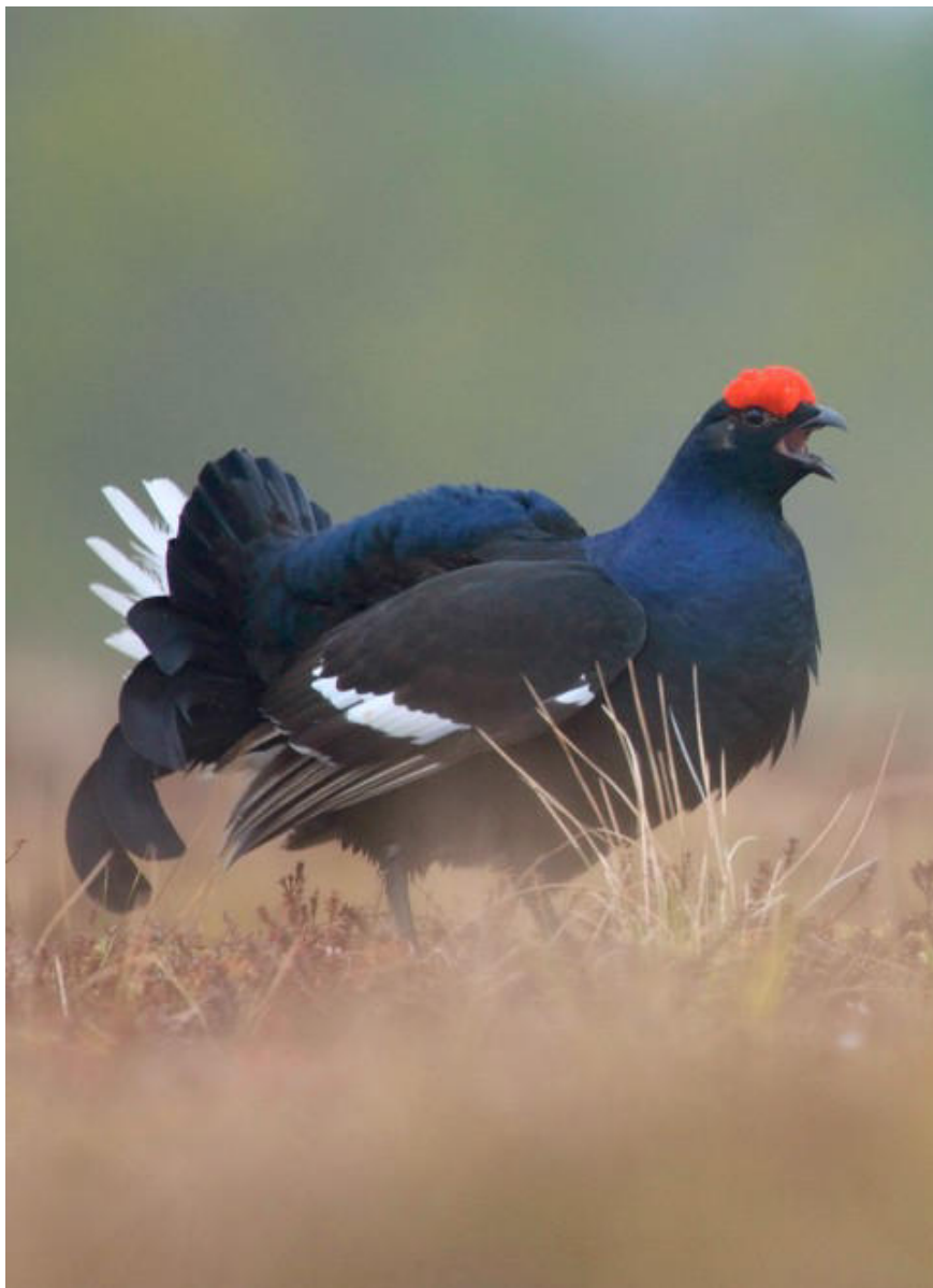
Birkhuhn ( Lyrurus tetrix )