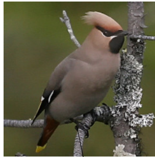
Seidenschwanz in Finnland