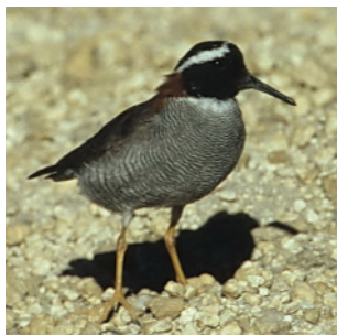
Bänderregenpfeifer in Peru