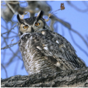
Virginia-Uhu in Texas