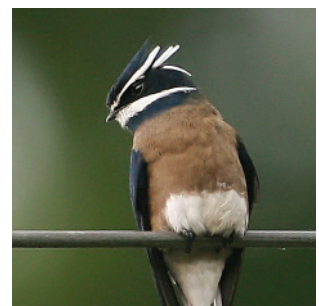
Ohrenbaumsegler auf den Philippinen